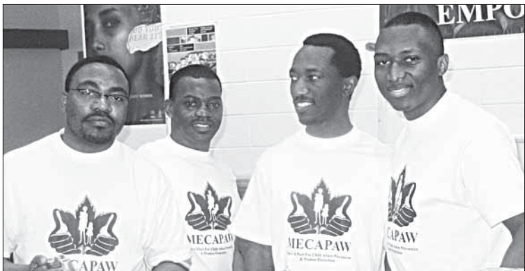
Youth Justice and Safety Workshop sponsored by MECAPAW

The Workshop was crowned with a basket ball tournament between the Rwandese Youth from Down Town Toronto and the Youth from O'Connor Community Centre.