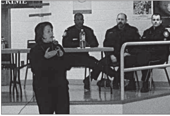
Hon addressing the youth at MECAPAW workshop

On April 14, 2007, Men's Effort for Child Abuse Prevention and Women Protection (MECAPAW) held a one day Workshop on Youth Justice and Safety. The Forum focused on the risk factors that result into the high detention rates of the Black Canadian Youth. It also focused on gangs and gun issues. Notably, one of the youth expressed concern that, when black youth walk together, the police will identify them as a gang while their white counterparts are walking together in the same number, the police will identify them as just friends walking together, the youth lamented! He went on to say, that, this kind of prejudice has created mistrust between the black youth and police and has resulted into psychological torture and restlessness